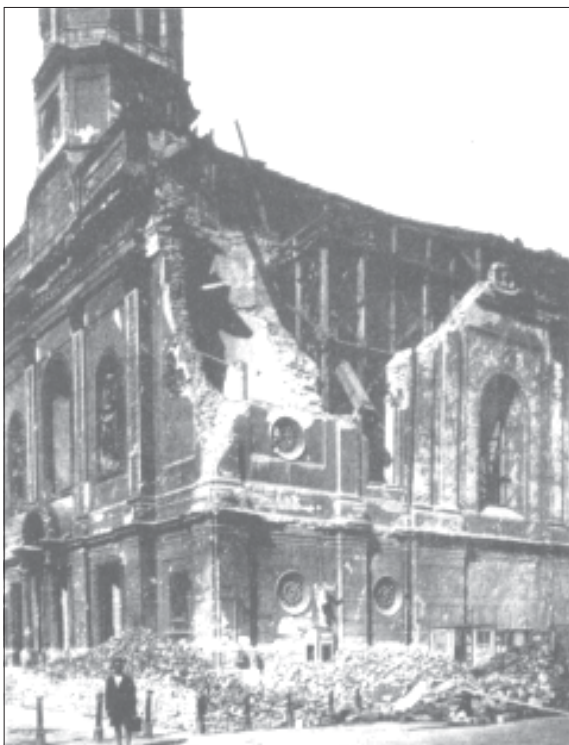
Kościół św. Nepomuka po bombardowaniu 15. marca 1945 roku

Cykl drogi krzyżowej namalowany przez Józefa von Führicha w latach 1844-1846 jest najważniejszym dziełem znajdującym się w tym kościele. Cykl ten składa się z czternastu freskoobrazów wielkości 240x185 cm. Kopie tych obrazów można znaleźć w wielu kościołach na całym świecie.