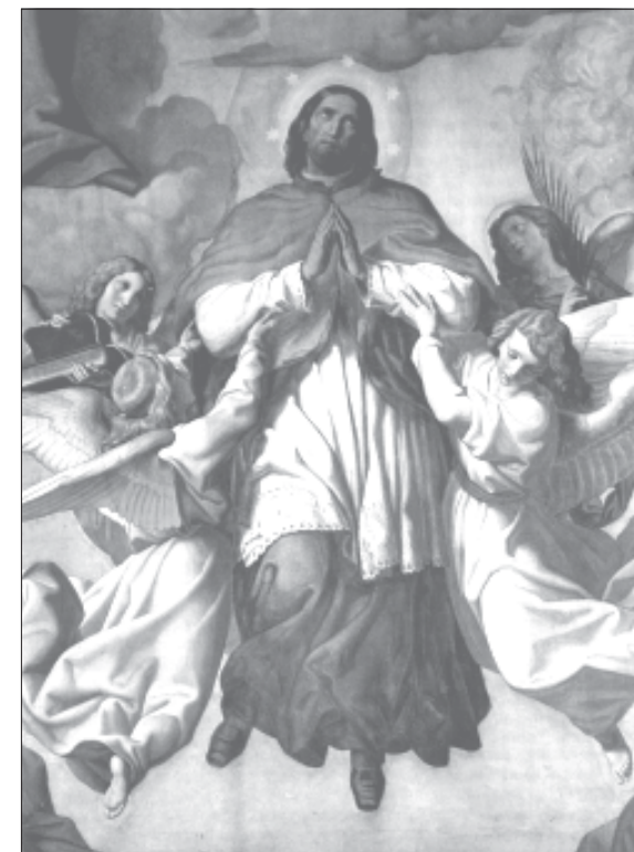
Przyj 3 cie 3 ew. Nepomuka do nieba (fresk z o 3 tarza g 3 3wnego - namalowany przez Leopolda Kupelwiesera)

Poni 3 ej siedz 1 aposto 3 owie, kt 3 rych imiona wypisane s 1 w ich aureolach. Znajduj 1 cy sie poni 3 ej po prawej stronie anio 3 trzyma w r 3 ekach