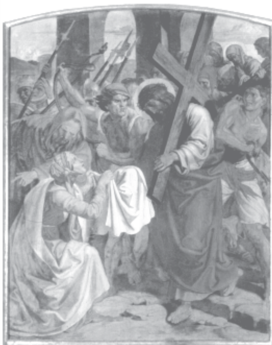
6. stacja: Weronika podaje Jezusowi chustkę.

W kancelarii parafialnej jest do nabycia przewodnik: „Droga krzyżowa - dzieło Führicha“