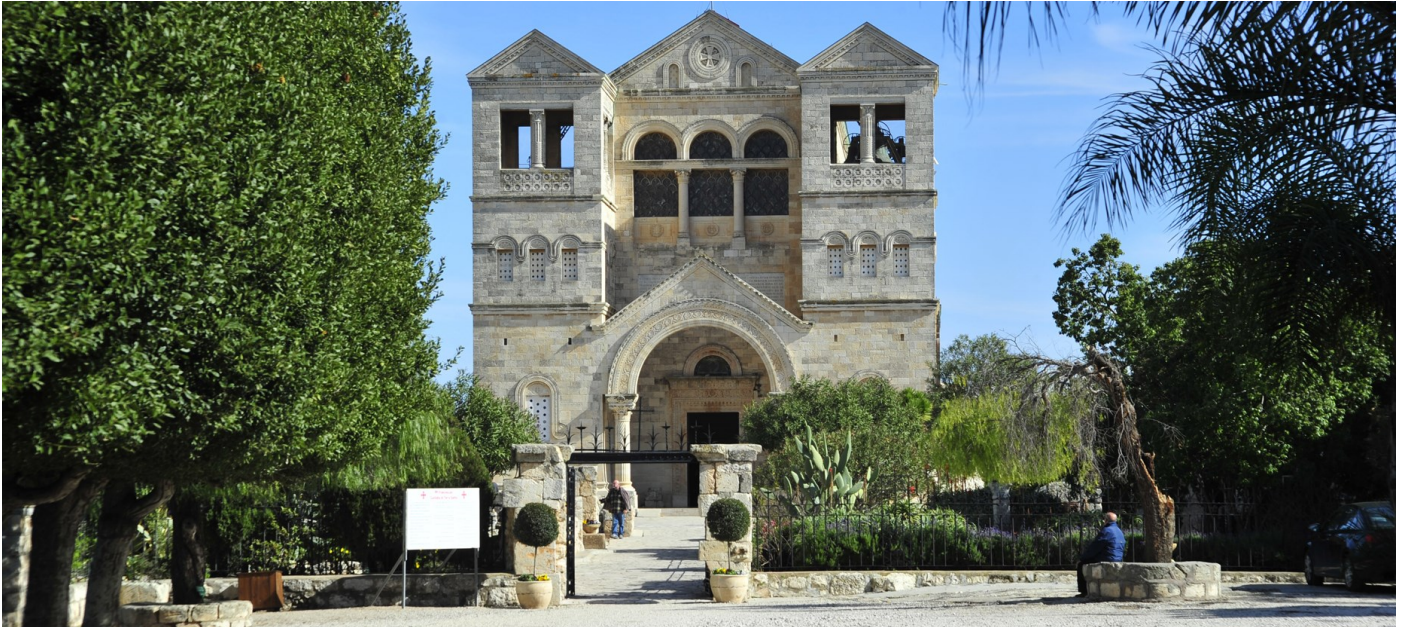
Verklärungskirche auf dem Berg Tabor