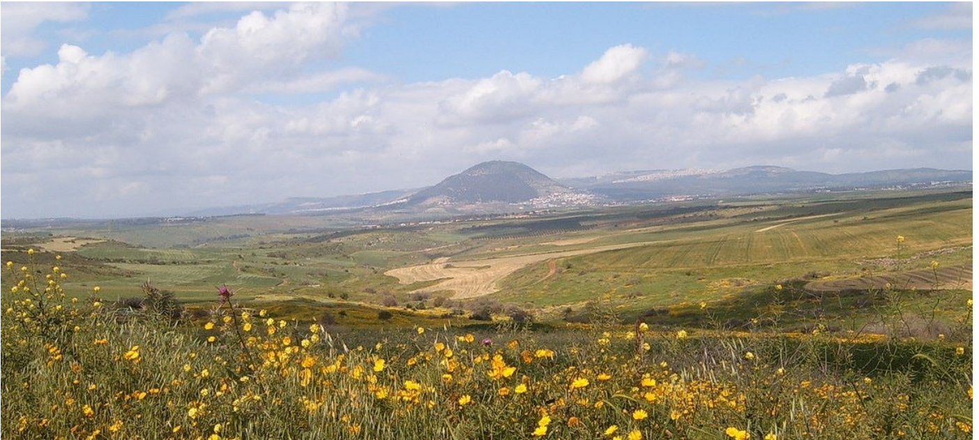
Der Berg Tabor in der fruchtbaren Jesreel-Ebene in Galiläa