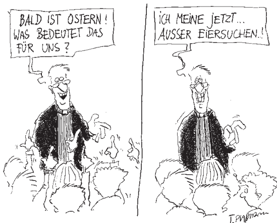
PFARRER PLUMANN'S SCHWERE STUNDEN