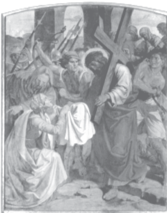
VI. Station: Veronika reicht Jesus das Schweiß Tuch.

In der Pfarrkanzlei und beim Schriftenstand ist ein Kreuzweg-Führer erhältlich. Informationen finden Sie auch auf unserer Homepage.