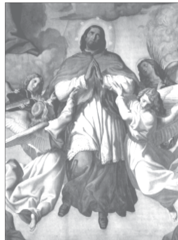
Aufnahme des Hl. Johannes Nepomuk in den Himmel (Hochaltarfresko von Leopold Kupelwieser)

Die ganze Altarwand wird beherrscht vom großen 1841 bis 1844 von Leopold Kupelwieser gemalten Fresko, das die Aufnahme des heiligen Johannes Nepomuk in den Himmel darstellt. Der thronende Christus ist von einer Schar Engel umgeben und hat Maria und Johannes den Täufer zur Seite. Unterhalb sitzen die in ihrem Heiligenschein namentlich bezeichneten Apostel. Der Engel rechts unten trägt ein Modell der