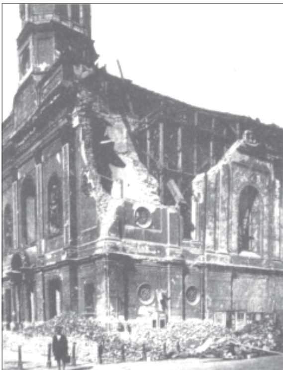
Die Kirche nach dem Bombentreffer vom 15. März 1945

Der von Josef v. Führich von 1844 bis 1846 gemalte Kreuzwegzyklus ist das wohl bedeutendste Werk in dieser Kirche und besteht aus vierzehn 240 x 185 cm großen Freskobildern; diesen Kreuzweg findet man als Kopien in hunderten Kirchen in aller Welt.