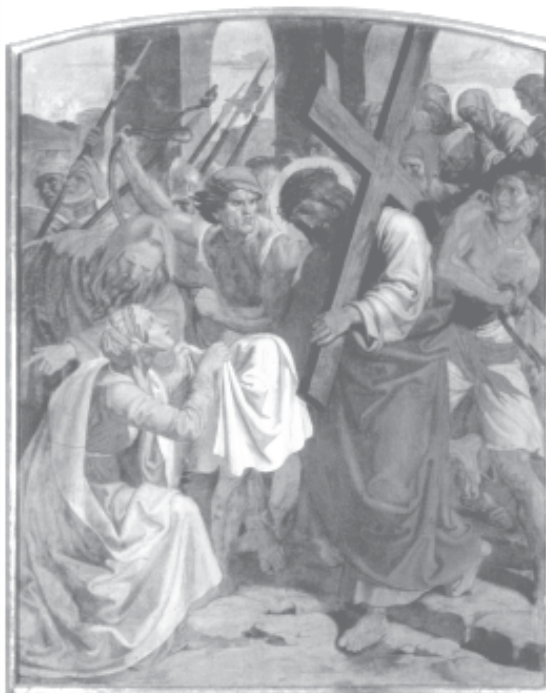
VI. Station: Veronika reicht Jesus das Schweißstuch.

In der Pfarrkanzlei ist auch der Führer „Der Führich-Kreuzweg“ erhältlich.