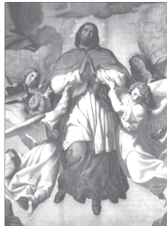
Aufnahme des Hl. Johannes Nepomuk in den Himmel (Hochaltarfresko von Leopold Kupelwieser)

Die ganze Altarwand wird beherrscht vom großen 1841 bis 1844 von Leopold Kupelwieser gemalten Fresko, das die Aufnahme des heiligen Johannes Nepomuk in den Himmel darstellt. Der thronende Christus ist von einer Schar Engel umgeben und hat Maria und Johannes den Täufer zur Seite. Unterhalb sitzen die in ihrem Heiligenschein namentlich bezeichneten Apostel. Der Engel rechts unten trägt ein Modell der